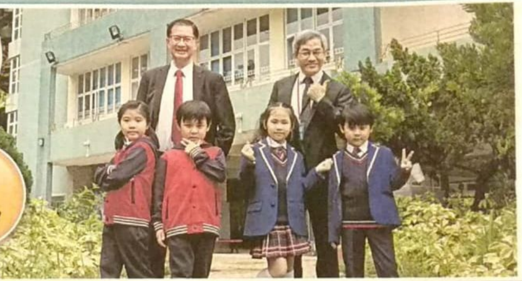
興德學校將於9月正式改名為「圓玄學院陳國超興德小學」，屆時將換上新校徽及校徽。