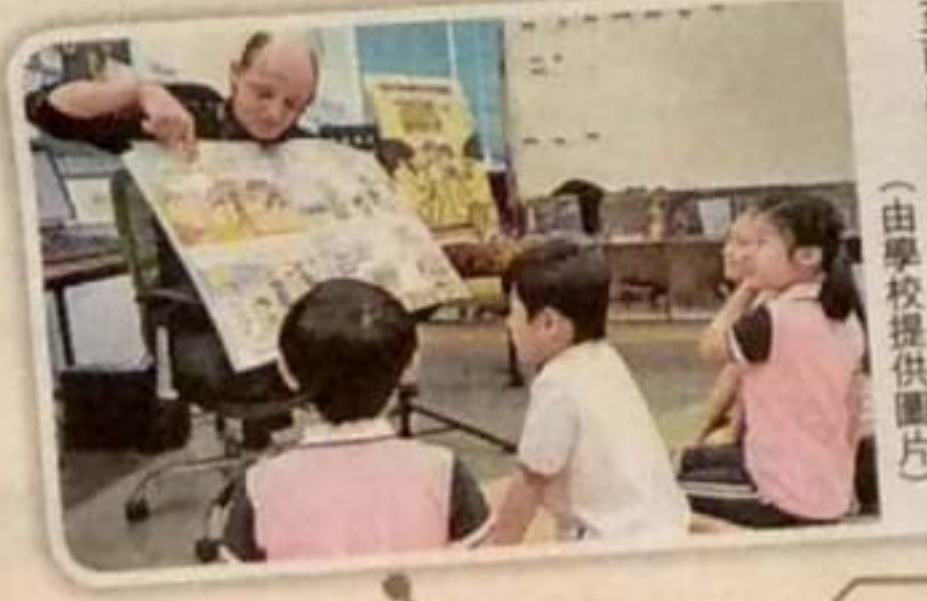
學校將推出5G智慧校園計劃，及逐漸提高外籍教師比例至兩成或以上。